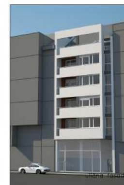
OSNOVA 4. SP.